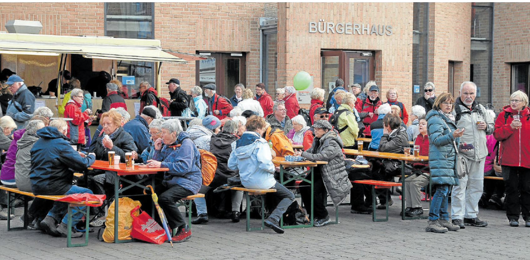
Nach der Wanderung war bei den Teilnehmern erst mal Stärkung angesagt.