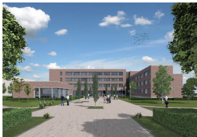
Illustration der neuen SARIA-Hauptverwaltung an der Werner Straße, Ansicht von den neuen Parkplätzen aus (altes Schwaag-Gelände)