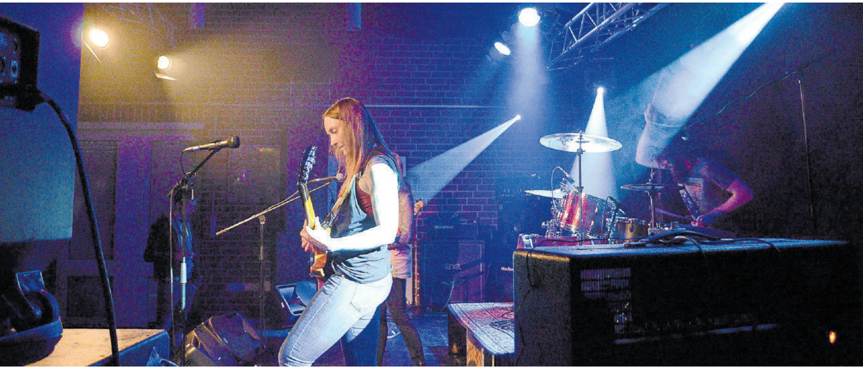
Bandconteste waren erneut einer der Höhepunkte im Programm des Sunshines.