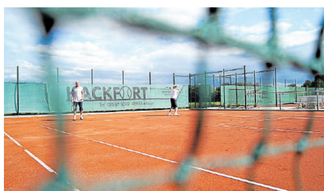
Fünf neue Tennisplätze wurden für die TG Selm gebaut.

gelben Filzkugeln über die Netze flogen, entsteht bald der Campusplatz. Sechs Plätze insgesamt müssen dem Campusplatz weichen, fünf neue sind an anderer Stelle geschaffen worden. „Ohne ein Entgegenkommen und dem damit verbundenen Wegfall der alten Plätze, hätten wir unsere Idee der Aktiven Mitte und des Campusplatzes nicht verwirklichen können. Somit kommen die neuen Tennisplätze nicht nur den Vereinsmitgliedern der Tennissgemeinschaft Selm