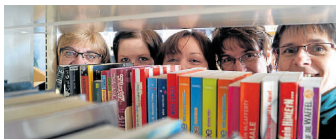
Das Team der BiB freut sich über jeden Besucher.

Darüber hinaus bietet die BiB demnächst Kinonachmittage für unterschiedliche Altersklassen an: Donnerstags, Start am