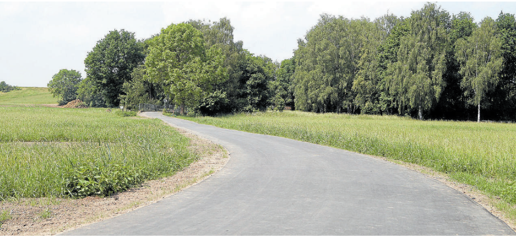
Nichts erinnert mehr an den schmalen Weg, der noch von Stacheldraht flankiert war.