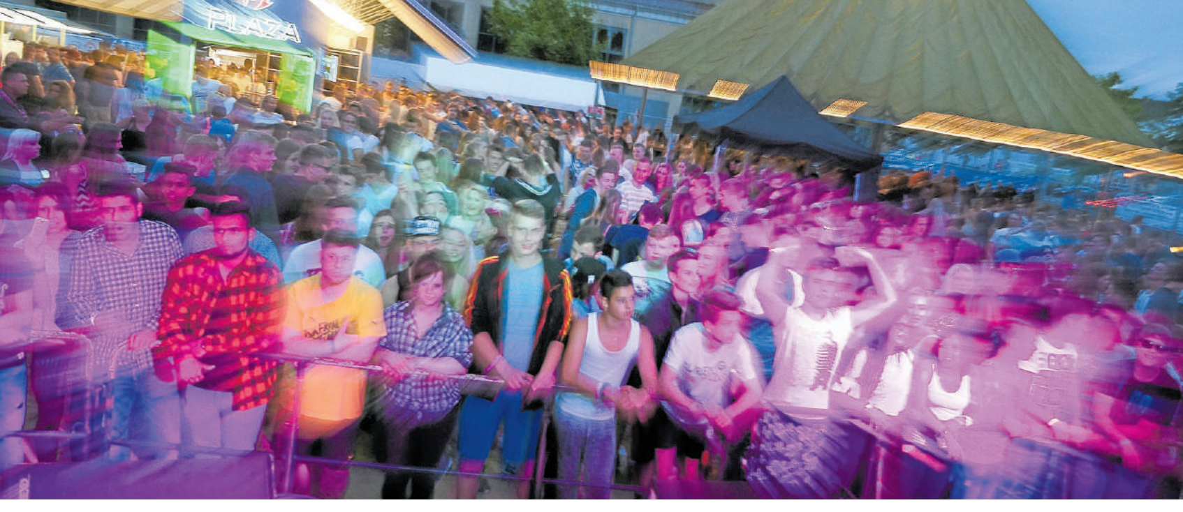
Gute Stimmung ist garantiert, wenn Freitag die Beachparty losgeht.