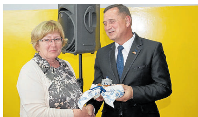
Brot und Salz für die neuen Freunde.