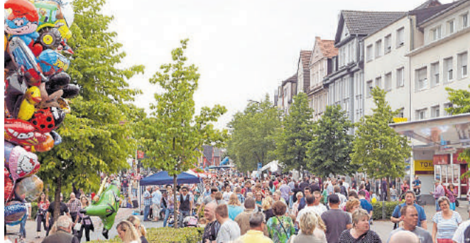
Auch in diesem Jahr werden wieder tausende Besucher zum Stadtfest-Sonntag erwartet.

Auf der gesperrten Kreisstraße geht es indes kulinarisch zu. Auf der Street-Food-Meile gibt es an verschiedenen Trucks und Außenständen die unterschiedlichsten Köstlichkeiten. Von Hot Dogs mit Avocado über Pulled-Pork bis hin zu Hoagie-Sandwiches – für jeden Geschmack wird etwas dabei sein. Sonntagskonzerte auf der Bühne auf dem Willy-Brandt-Platz sowie weitere Aktivitäten auf und neben der Kreisstraße runden den Stadtfestsamstag ab. www.stadtfest-selm.de