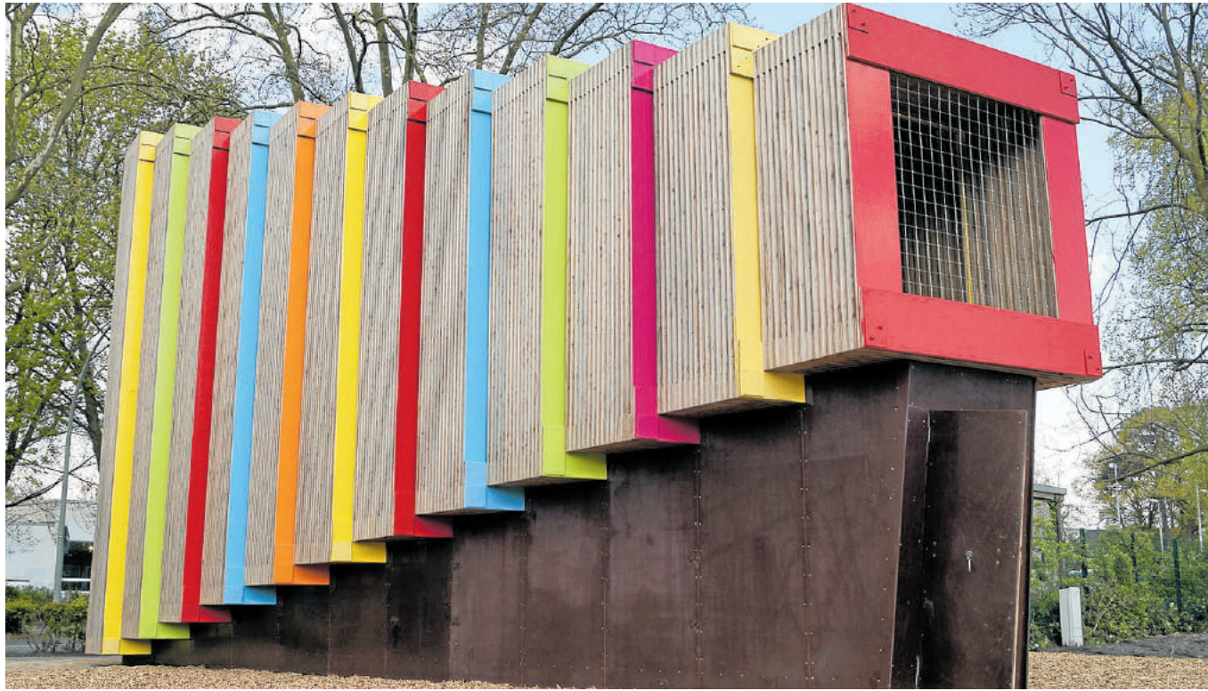
Schon von Weitem ist die Sehstation ein Hingucker.