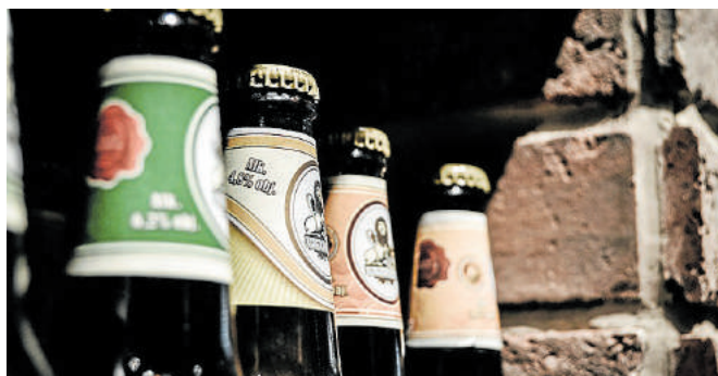
...und Bier gibt es am 13. August zu verköstigen.

Für jeden Geschmack wird etwas zu finden sein. Zum Probieren gibt es offene Weine, wer sofort seinen Lieblingswein gefunden hat, kann diesen natürlich auch flaschen-