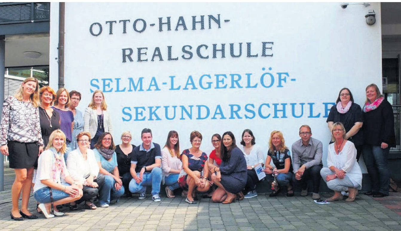
Das Kollegium der Schule vor dem neuen Namensschriftzug.