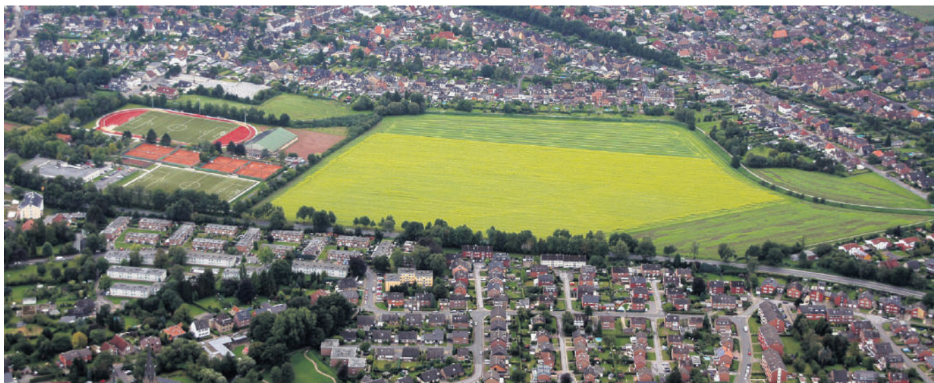
Auf dieser zurzeit noch landwirtschaftlich genutzten Fläche soll in ein paar Jahren die Stadt am Wasser entstehen. Links davon entsteht die „Aktive Mitte“.