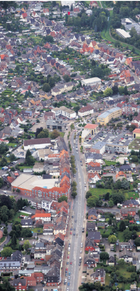
Die Kreisstraße im Zentrum.