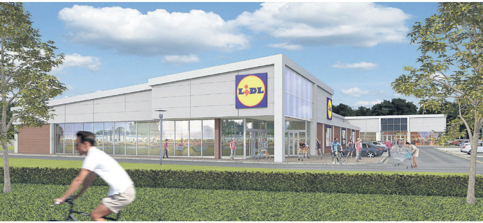
So könnte der fertige Lidl-Markt von der B236 aus gesehen aussehen.