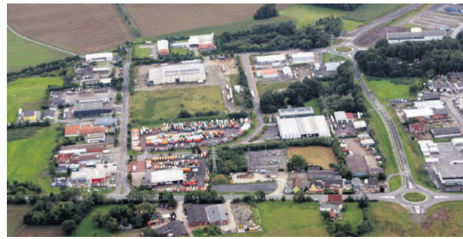
Die Firma Saria (oben) möchte ihren Standort an der Werner Straße erweitern. Das Gewerbegebiet Werner Straße (unten) grenzt unmittelbar an die K44n.