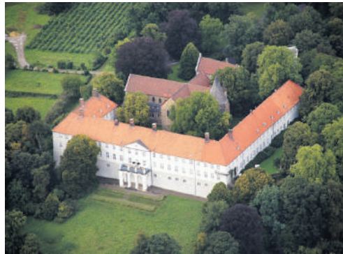
Das Schloss Cappenberg ist der Kulturstandort im Kreis Unna.