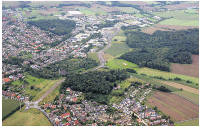
Die Umgehungsstraße Zeche-Hermann-Wall verbindet die Kreisstraße (unten) mit der Werner Straße.