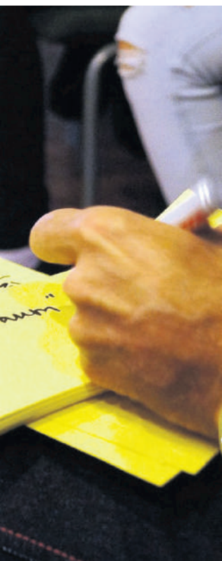
Ideen wurden gesucht...