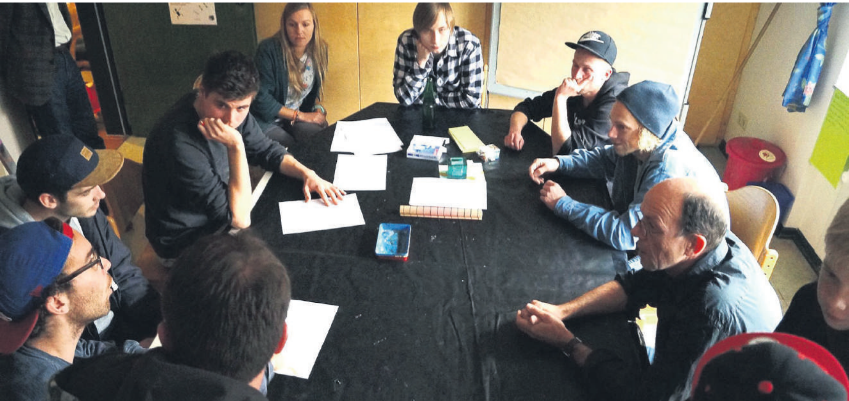
Die Skatergruppe machte bereits konkrete Vorschläge für den neuen Skaterpark.