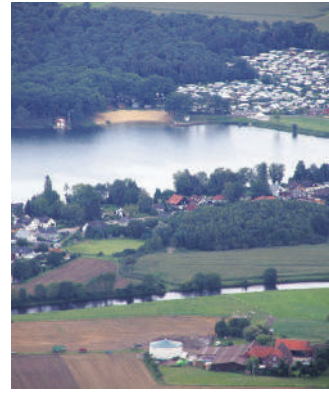
Der Ternscher See mit dem angrenzenden Campingplatz. Gut zu sehen ist das Strandbad.