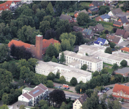
Die Kirche St. Josef im Stadtteil Selm mit dem angrenzenden Altenwohnhaus St. Josef.