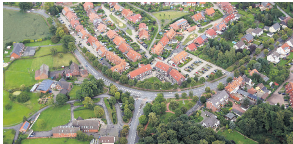
Der Ortsteil Cappenberg mit dem weit über Selm bekannten Haus Kreutzkamp (unten links im Bild.)