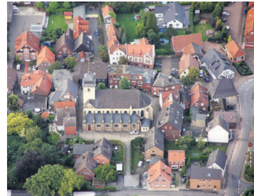
Die Stephanus-Kirche in Bork.