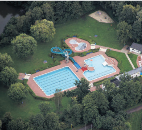
Das Selmer Freibad.