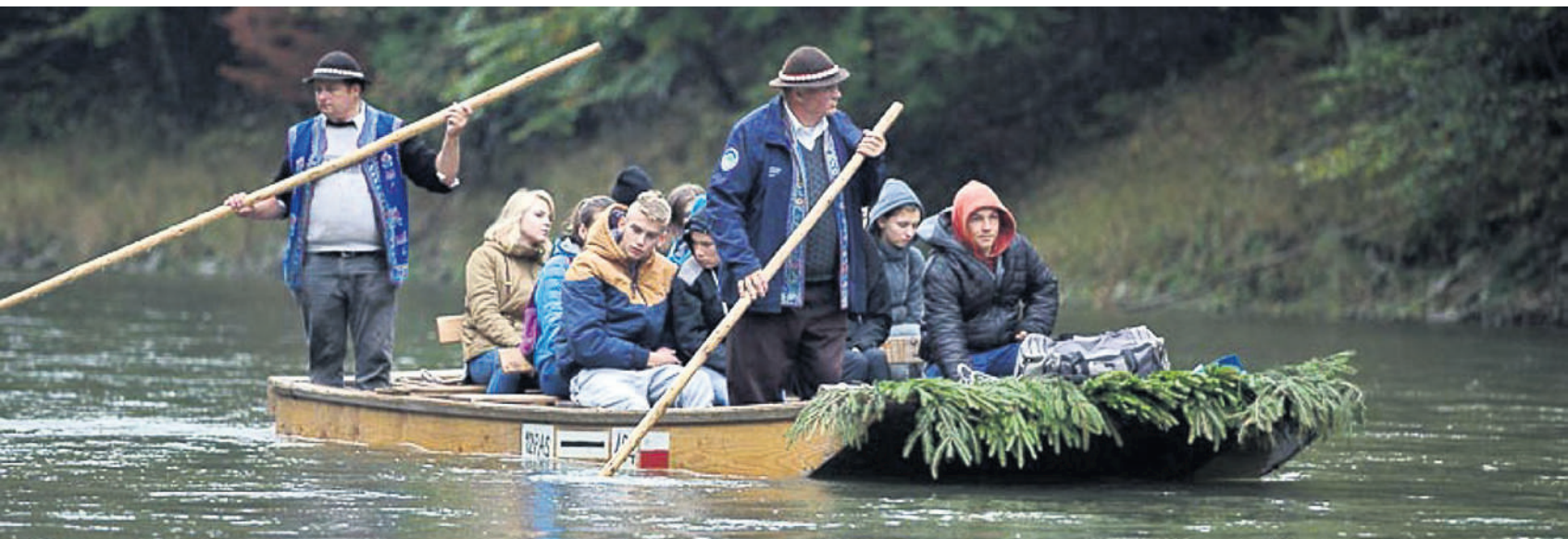
Vormittags bis nachmittags gab es eine Tour auf dem Floss entlang der polnisch-slowakischen Grenze.