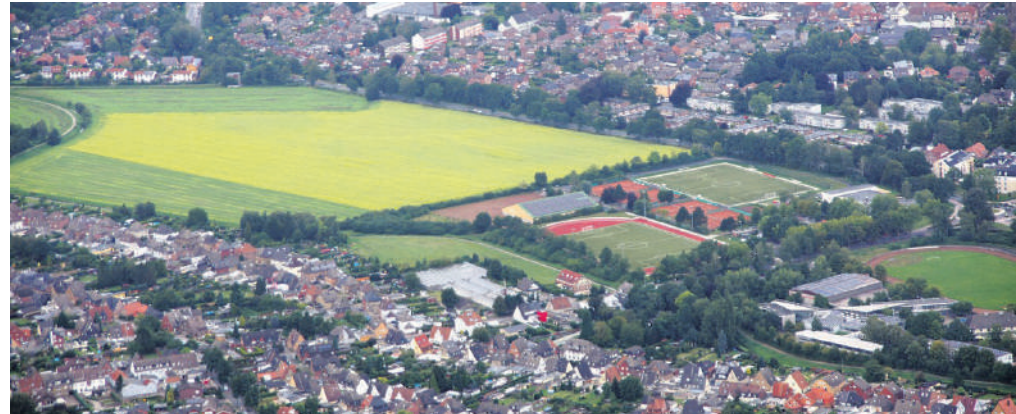
Die neue Sportanlage mit den beiden Kunstrasenplätzen. Nur einen Steinwurf entfernt entsteht die Aktive Mitte.