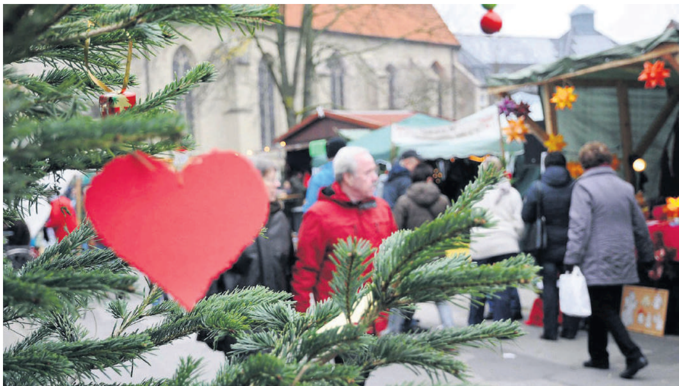
Nicht nur der Duft von Plätzchen und Glühwein, auch die Stimmung zieht die Besucher aus der ganzen Region zum Adventsmarkt nach Selm.