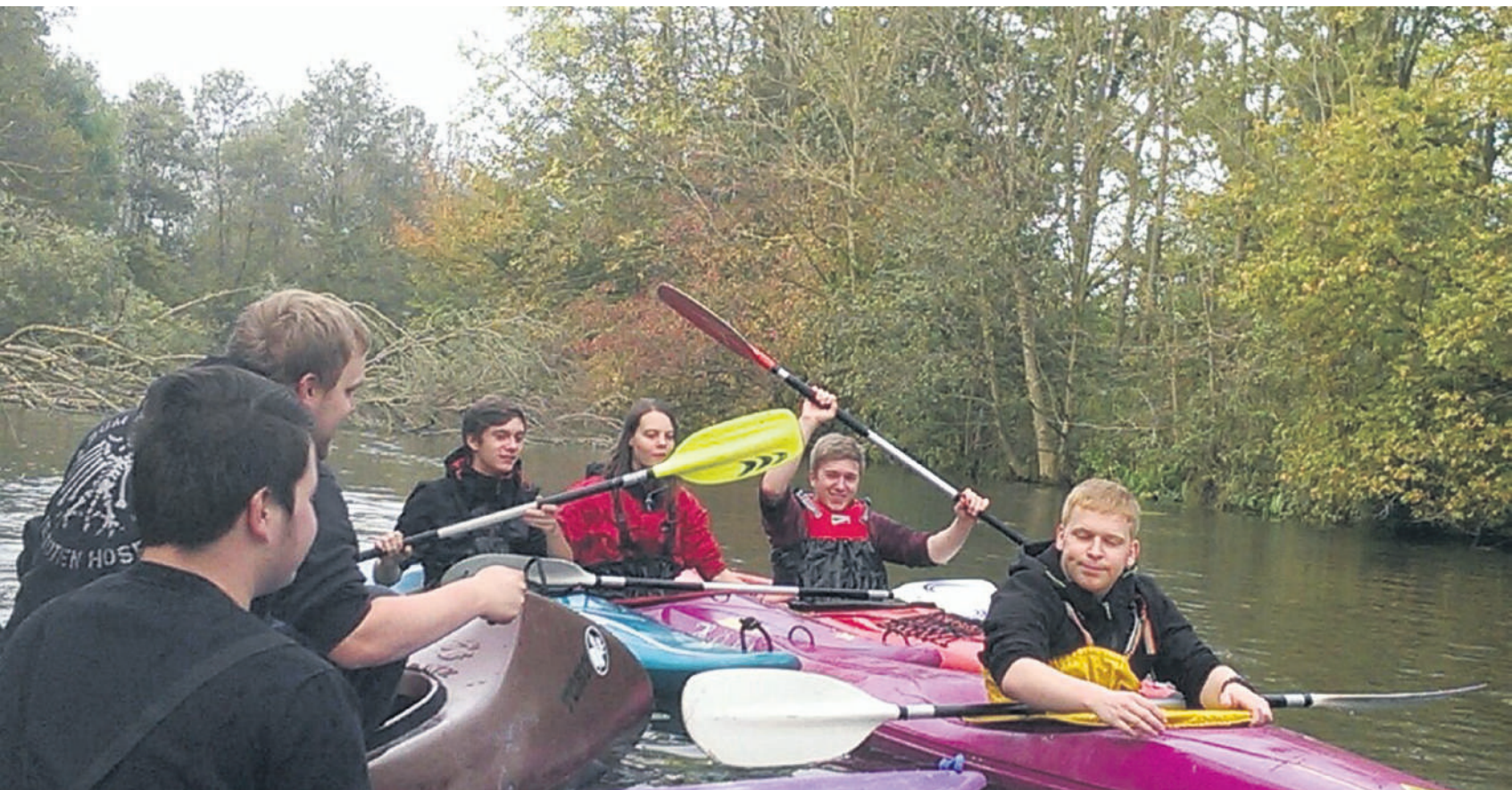
Das Jugendparlament organisierte als Teambuildingmaßnahme eine Kanutour.