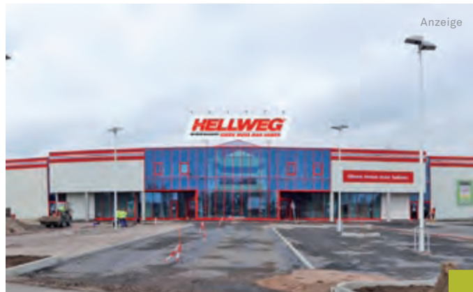
Am 21. März eröffnet der HELLWEG Markt in Selm.