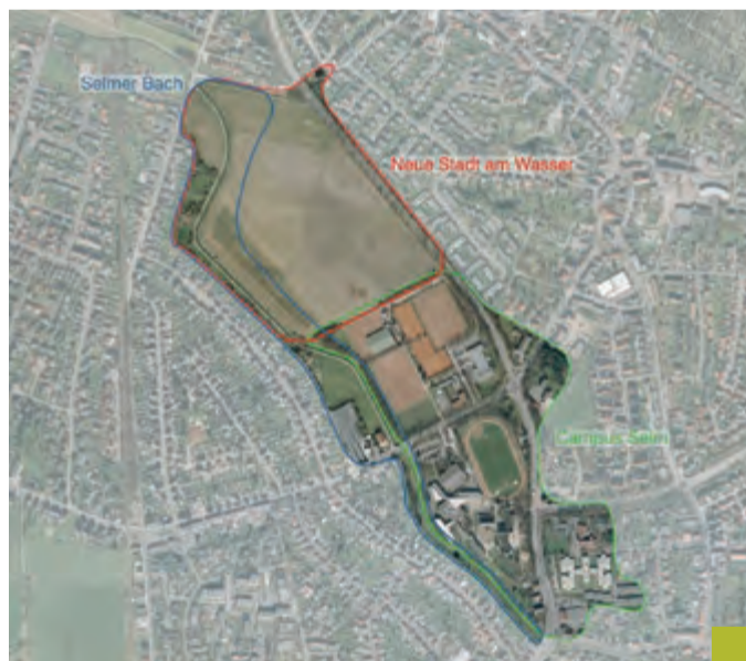
Die Grafik zeigt die Übersicht der Bausteine „Wir sind Selm – Selm wird aktiv“.

In zwei Kooperationen und einem eigenen Projekt hat Selm sich nun beworben. In einem mehrstufigen Verfahren von der Idee über die Skizze zur Studie bis zur Umsetzung wird über die Projekte entschieden. Aber da sind die Verantwortlichen im Amtshaus für jedes einzelne guter Dinge. „Bewegtes Land“ etwa heißt das Projekt, zudem sich die