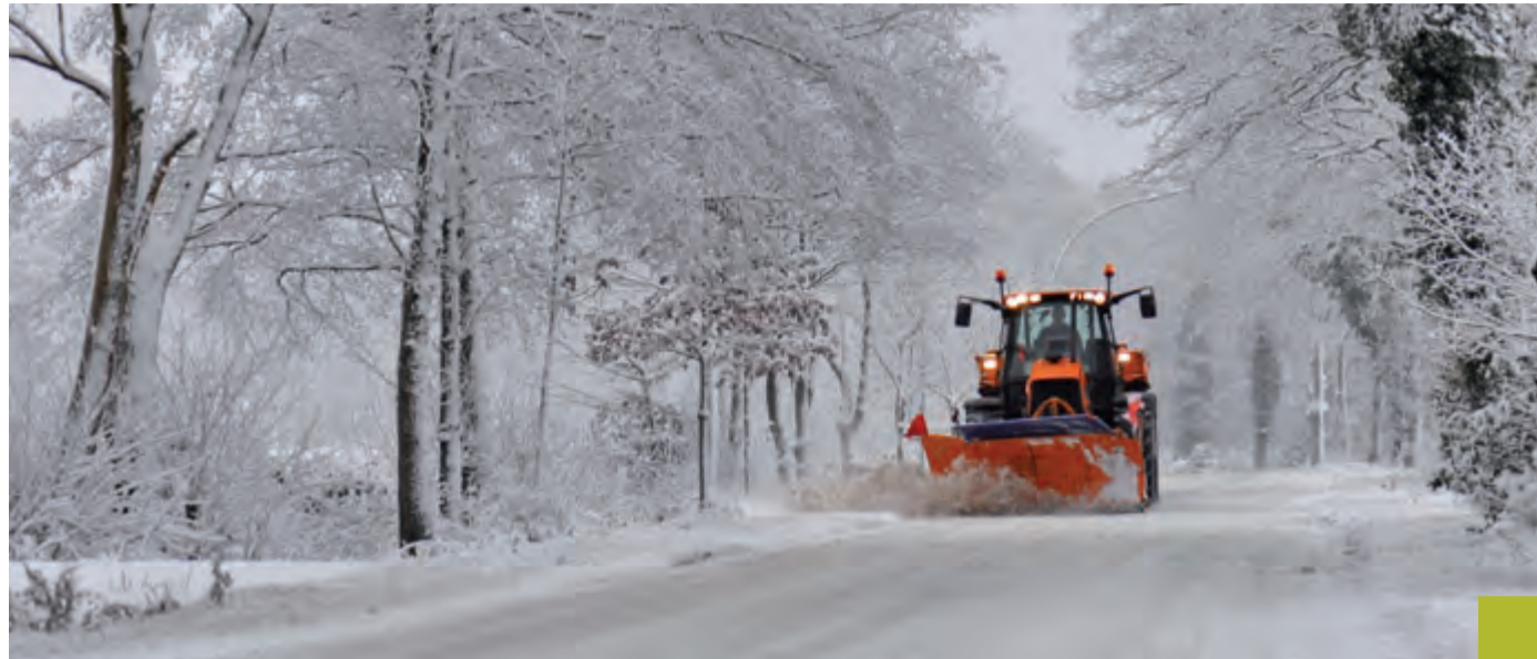
Die Stadtwerke Selm haben den Winterdienst erweitert: Wurden bisher 46 Kilometer Straße von Schnee und Eis geräumt, sind es jetzt 97 Kilometer.

So hatten die Erfahrungen aus den vorgenannten Wintern gezeigt, dass Bewohner von Anliegerstraßen, in denen laut Satzung kein kommunaler Winterdienst geleistet wurde, gleichwohl nachhaltig einen solchen forderten. Teilweise wurde Winterdienst dann auch dort geleistet. In der Folge setzte in der Bevölkerung eine Gerechtigkeitsdiskussion ein, in deren Verlauf über Leistung und Gegenleistung gestritten wurde. Im Ergebnis entschied der Stadtrat im Spätherbst 2012, dass die Stadtwerke Selm ab dem 1. Januar 2013 in allen Straßen innerhalb der geschlossenen Ortslagen Winterdienst durchführen sollen. Auf der Basis eines zweistufigen Gebühren- und Prioritäten-