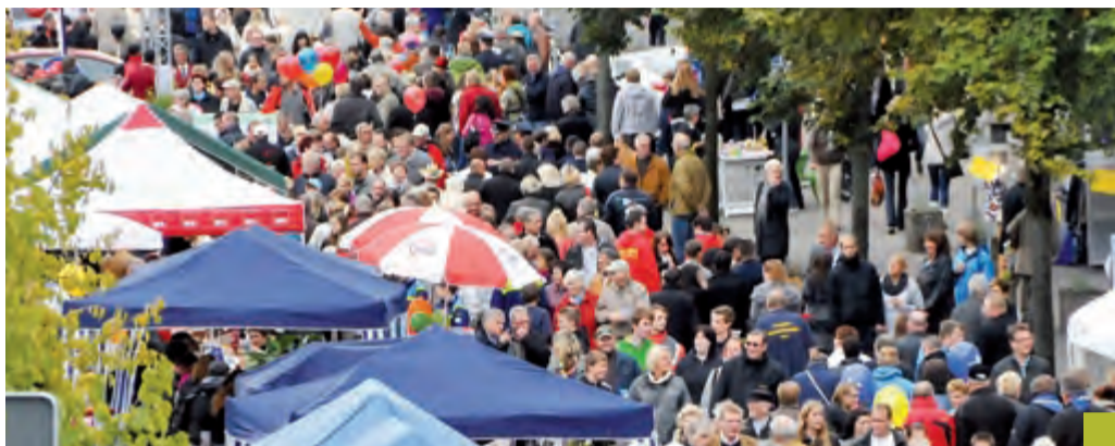
Wie beim Jubiläum im vergangenen Jahr lockt das Stadtfest wieder viele Besucher.

Gleich drei Tage lang lockt das musikalisch-bunte Programm „große“ und „kleine“ Selmerinnen und Selmer zum Stadtfest mit dem Motto „Gemeinsam können wir das...“.