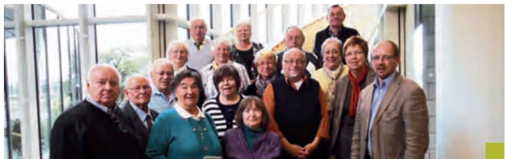
Der Seniorenbeirat mit Partnern besuchten den Düsseldorfer Landtag.

„Der demografische Wandel stellt uns vor Herausforde-