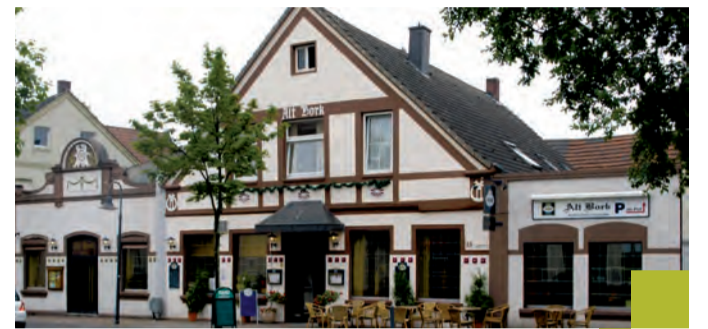
„Alt Bork“ – das Gasthaus mit dem besonderen Service.

Ein besonderes Highlight zur Weihnachtszeit sind die Gänse und Enten. Dieses knusprige Schmankerl erhält man ebenfalls auf Bestellung.