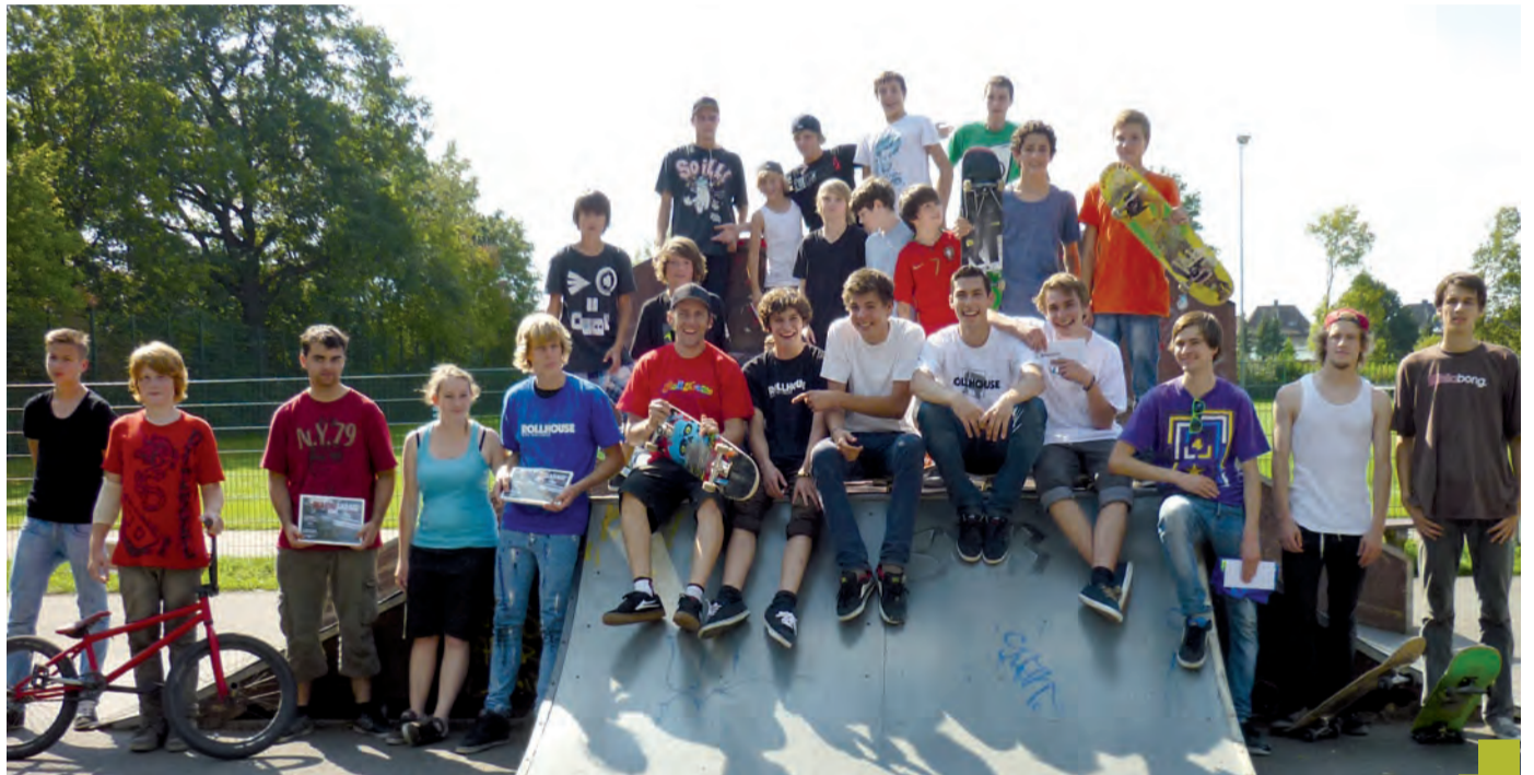
Das Jugendzentrum Sunshine bietet Jugendlichen ein großes Freizeitangebot, beispielsweise der Skater-Contest. Lesen Sie mehr auf Seite 3.

Trotz Geldknappheit bleiben die Spielplätze in Selm erhalten – dafür setzen sich die Anwohner ein.