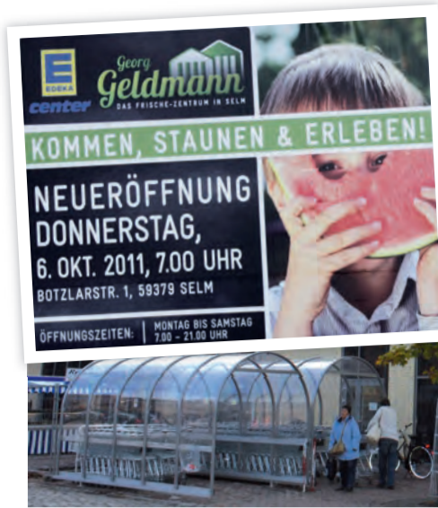
Der erste Schritt: der Edeka-Markt.