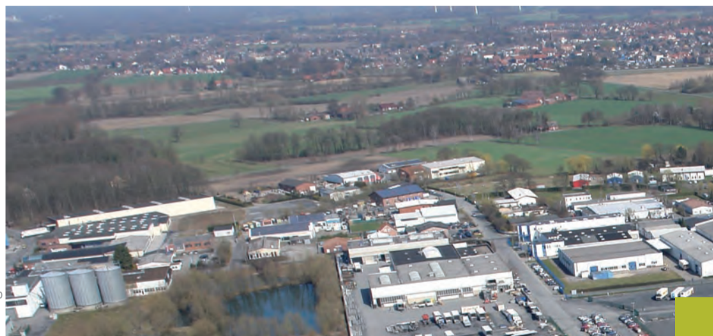
Gewerbegebiet „Am Dieselweg“

Informationen zu Grundstücken und Bebauungsmöglichkeiten Stadt Selm | Amt für Stadtentwicklung und Bauen Hans-Guenter Brilla | Wolfgang Händschke Telefon: 02592 69138 | 02592 69291 E-Mail: h.brilla@stadtselm.de | w.haendschke@stadtselm.de