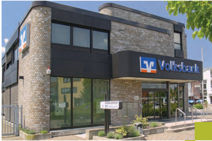
Kompetente und kostenlose Beratung vor Ort.

Wer seinen Ruhestand genießen und den eigenen gewünschten Lebensstandard im Alter halten möchte, muss schon früh dafür sparen. Zu diesem Ergebnis kommt Stiftung Warentest in der Ausgabe von Finanztest (12/2010) und rät vor allem jungen Menschen zum Riester-Sparen mit Fonds. Doch wie findet man die richtige Altersvorsorge?