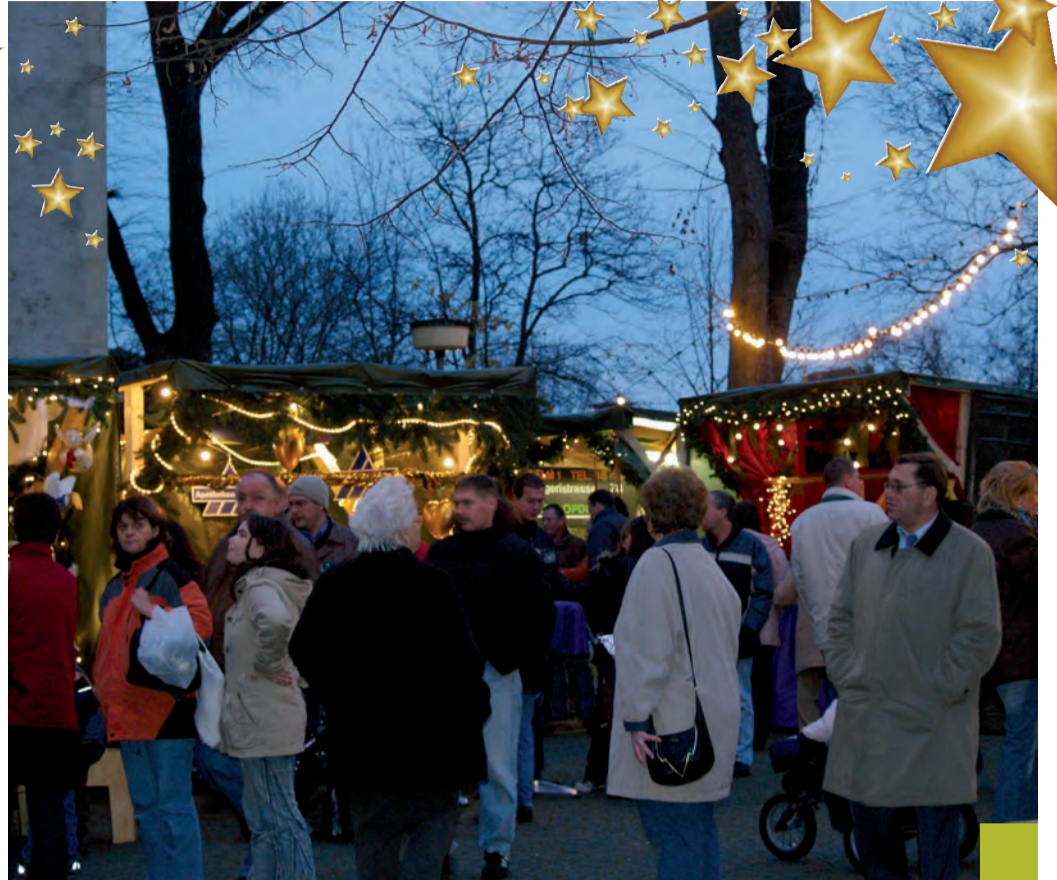
Buntes Treiben auf dem Adventsmarkt.

Weitere Infos und Aktualisierungen erhalten Sie unter http://www.werbegemeinschaft-selm.de/ .