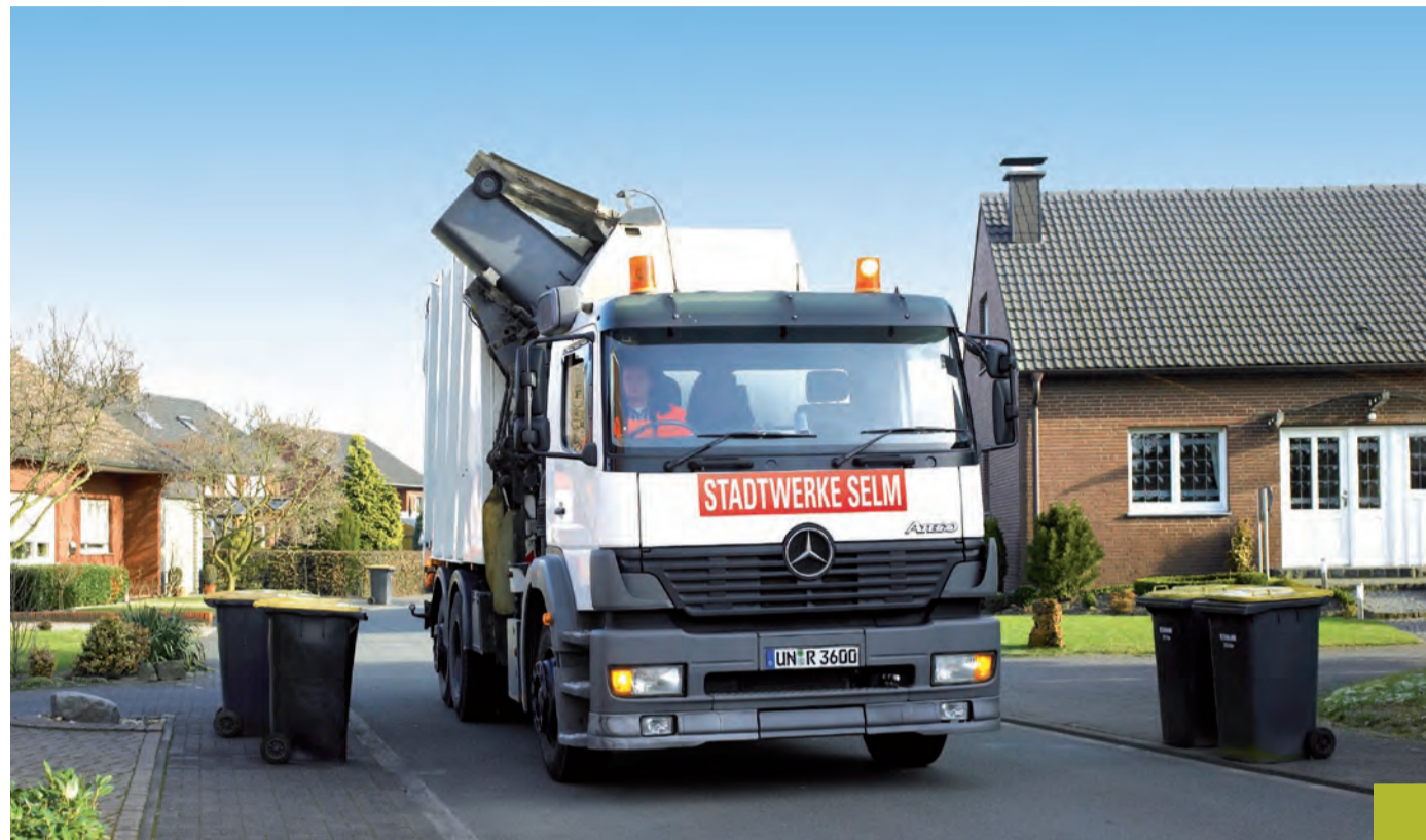
Sorgen für eine saubere Stadt Selm: die Stadtwerke.

Seitdem sind die Stadtbetriebe Selm GmbH neben der Abfallentsorgung und der Straßenreinigung auch für die Durchführung der Stra-