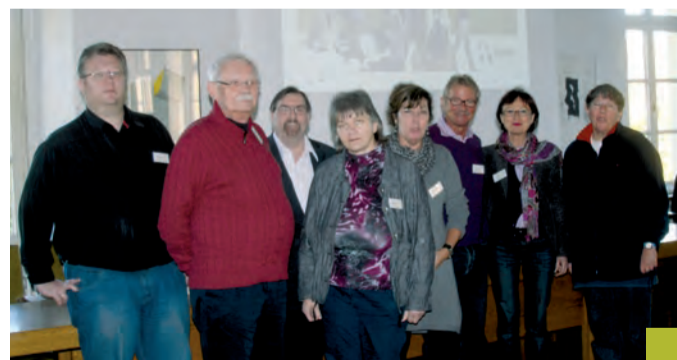
Die Teilnehmer befassten sich mit dem sozialen Miteinander.

Entscheidend sei, dass man weiß, wie und wo geholfen werden kann. Die kürzlich ins Leben gerufene Ehrenamtsbörse sei ein wichtiger Schritt, man wünsche sich unter den Teilnehmern aber noch weitere niederschwelligere Möglichkeiten. Zu beidem, Ehrenamtsbörse und erweitertem Angebot, hat der Workshop Ideen entwickelt, die nun in die Kampagne einfließen sollen.