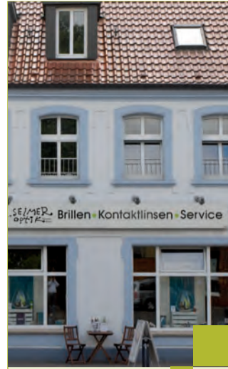
Der Spezialist vor Ort.

Nur ein Check für maximale Förderung – bei der Beantragung der Riester-Rente unterstützt Sie Ihr Vorsorgeexperte von der Volksbank Selm-Bork eG.