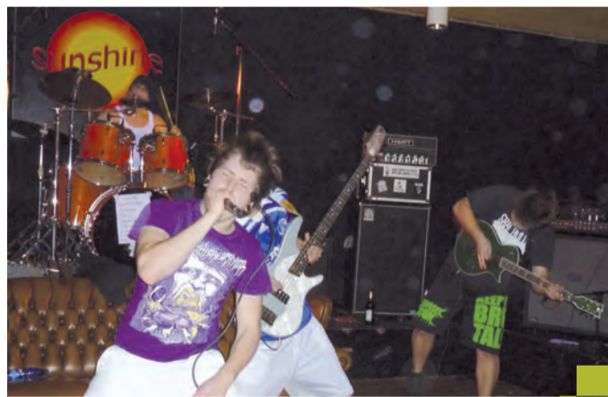
Konzerte der Sunshine-Bands stehen immer auf dem Programm.

Es ist viertel vor vier. Einige Jugendliche stehen vor dem Jugendzentrum Sunshine. Treten unruhig von einem Bein auf das andere. Erzählen sich, wie es in der Schule war. Dann endlich um Punkt vier öffnet sich die Tür. Sie stürmen hinein. Die Jungen kickern, spielen Billard oder Air-Hockey. Die Mädchen setzen sich an die Theke oder auf die gemütlichen Sofas und quatschen.