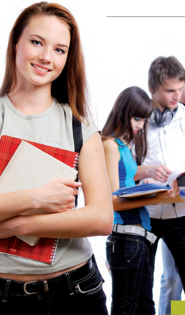
Eine Ausbildung bei der Sparkasse ist ein optimaler Berufsstart.