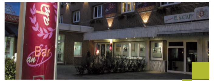
Seit 1974 vor Ort: das An-Hotel.

können zusammen mit dem Personal des Hotels geplant und durchgeführt werden. Sollten die Gäste darüber hinaus nach einer tiefwirkenden Entspannung suchen, bietet das Hotel Reiki-Behandlungen zu erschwinglichen Preisen an. Neue Öffnungszeiten: Mo, Die, Mi 17 – 22 Uhr Do 17 – 23 Uhr Fr 17 – 1 Uhr Sa 10 – 1 Uhr So 10 – 14 Uhr Infos und Buchungen unter: www.an-hotel.de oder Telefon: 02592 3773.