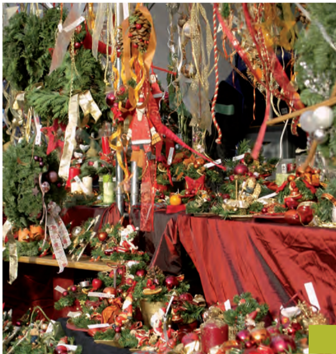
Weihnachtsdekoration an den Ständen.