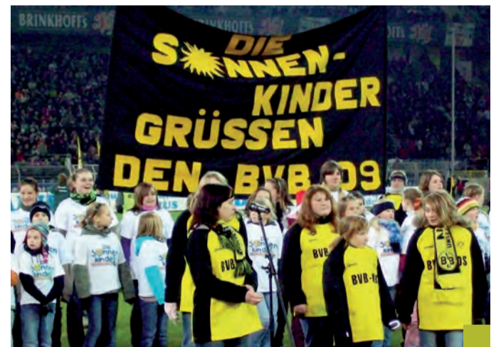
Sonnenkinder singen beim BVB 09 in Dortmund.